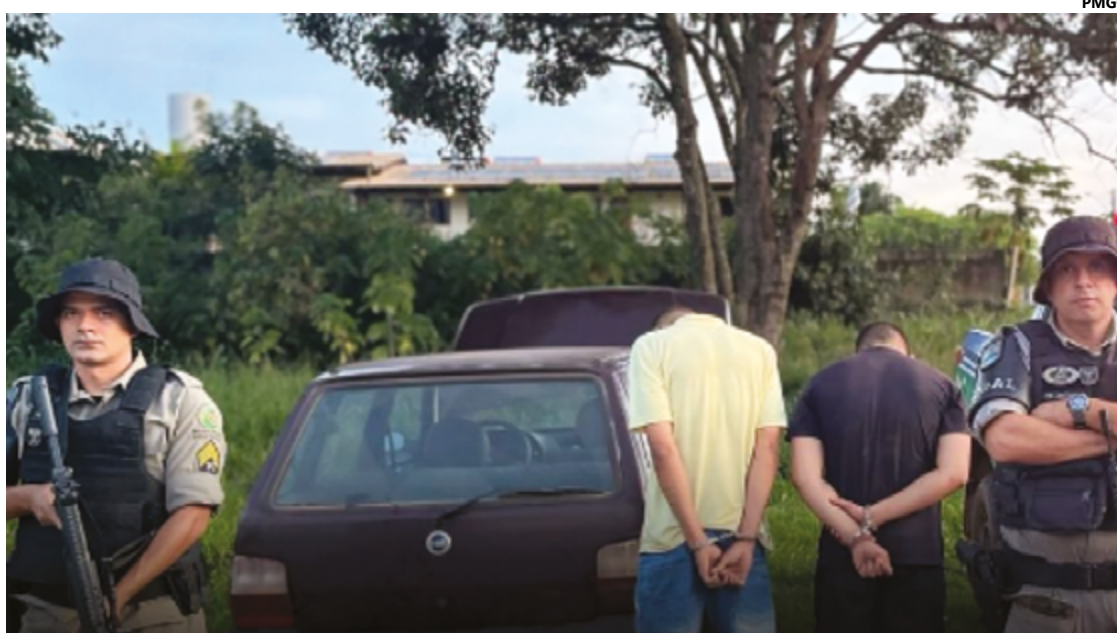
Os indivíduos detidos foram encaminhados à delegacia local, onde aguardam as providências cabíveis por parte do Poder Judiciário

Os indivíduos detidos foram encaminhados à delegacia local, onde aguardam