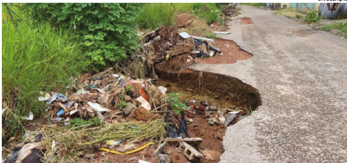
Segundo relatos dos próprios moradores, quando chove, a água desce com força pelas ruas, causando danos severos e tornando-as praticamente intransitáveis para veículos

Em uma reportagem veiculada pela TV Entorno, diversos moradores expressaram seu sentimento de abandono pelas autoridades e clamaram por providências para garantir a segurança da população. Eles ressaltaram que todos contribuem com seus impostos e esperam um retorno adequado em termos de infraestrutura por parte da gestão municipal. Além disso, os moradores também destacaram a carência de iluminação pública nas ruas da quadra, o que agrava ainda mais a sen-