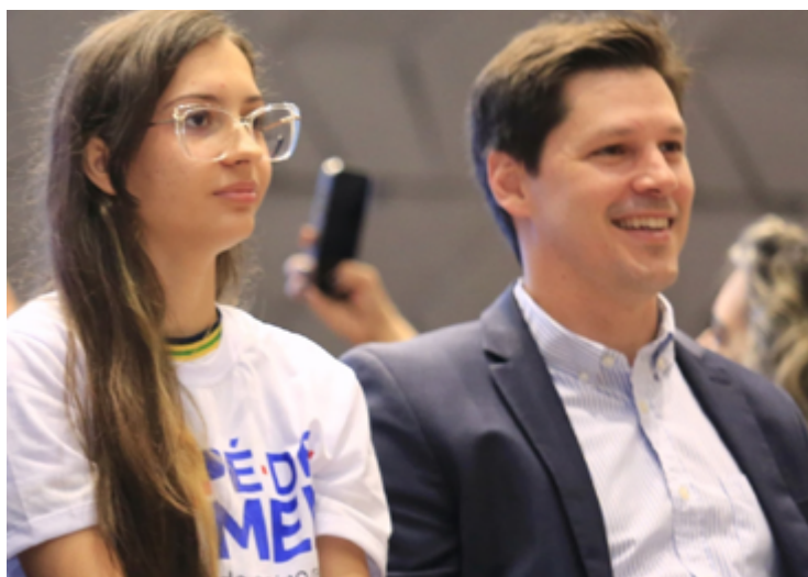
Daniel Vilela durante lançamento do programa: vice-governador defende programas sociais e educacionais para combater evasão

Ele explicou: “o programa oferece um incentivo mensal de R$ 200, que pode ser sacado a qualquer momento. Além disso, prevê-se a realização de depósitos de R$ 1 mil ao final de cada ano letivo concluído, incentivando a continuidade dos estudos. Levando em conta as dez parcelas de incentivo mensal, os depósitos anuais