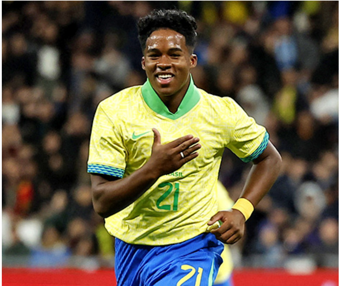
O atacante Endrick, ainda do Palmeiras, foi um dos personagens do jogo, porque entrou no segundo tempo e fez o gol que deu nova vida à seleção

O próximo jogo do Brasil será em 8 de junho, contra o México. Mas não há mais partidas antes da convocação final para a Copa América.