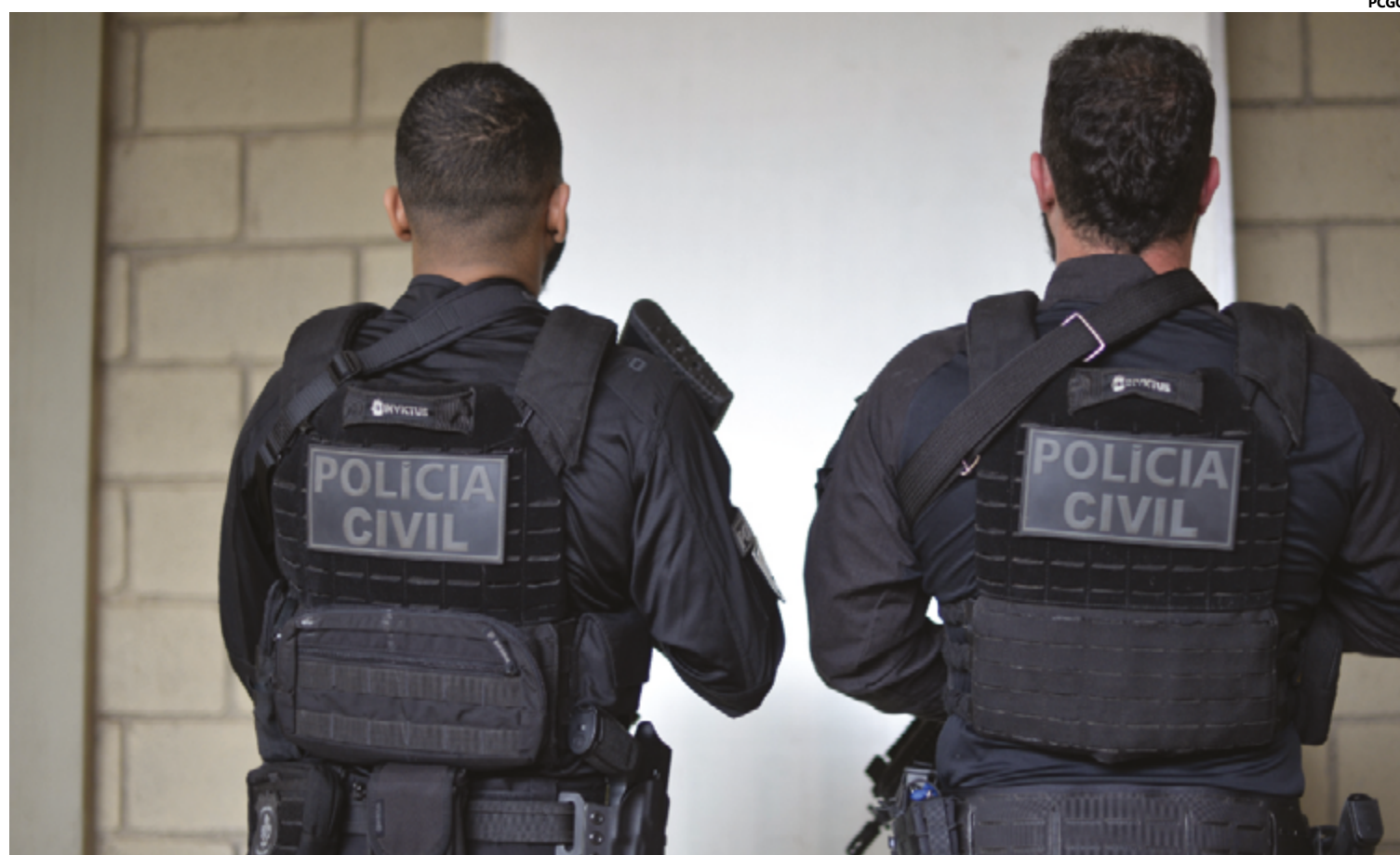
A ação teve início após o registro de ocorrências referentes ao furto de uma grande quantidade de animais

As investigações apontaram que o indivíduo procurado estaria na cidade de Águas Lindas de Goiás. No dia 23, os agentes cumpriram o mandado de prisão na referida localidade, efetuando a detenção do suspeito.