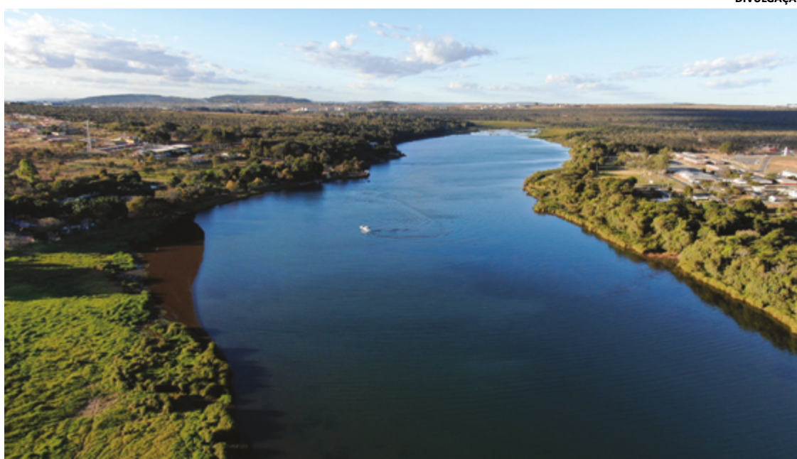
Lagoa Feia em Formosa

Quando os dados são analisados por região, no total de doze, a que mais arrecada é a Região de Negócios Turísticos e Tradições, em segundo vem a das Águas Quentes, e em terceiro ficou um conjunto de municípios fora das regiões. Na sequência, em quarto lugar, aparece a mais nova Região