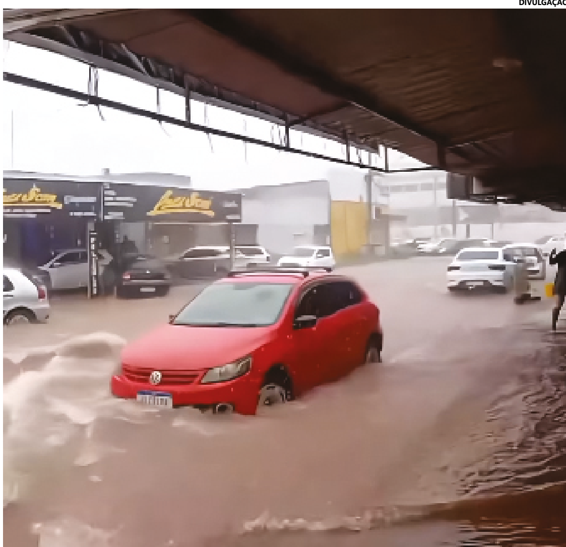
Imagens do último final de semana registradas por moradores

A constatação de que as obras de drenagem não resolveram o problema reforça as críticas sobre o uso inadequado de recursos públicos. Os moradores continuam enfrentando os desafios da falta de infraestrutura urbana, exigindo medidas urgentes por parte das autoridades municipais para resolver essa questão que afeta diretamente a qualidade de vida da população de Valparaíso de Goiás.