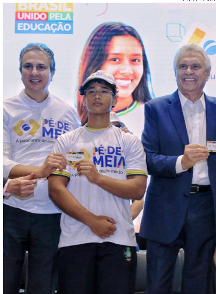
Governador Ronaldo Caiado e Camilo Santana: união de entes federados com missão de manter estudante secundarista na escola

O evento contou com a participação de cerca de 400 alunos da rede pública de ensino que estiveram no local para prestigiar o lançamento do programa