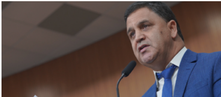
Wilde Cambão: prazo para emendas parlamentares