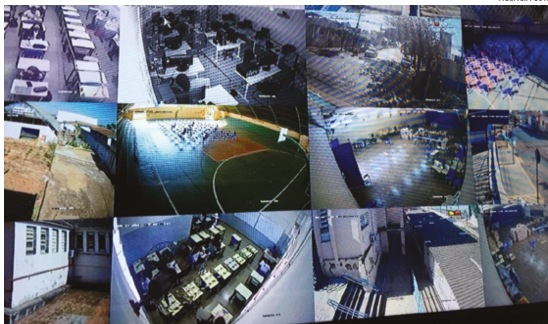
Medida do Governo Estadual objetiva enfrentar a violência no ambiente escolar e promover a cultura de paz nas instituições

Os testes são realizados há pouco mais de um mês e, neste período, a equipe descobriu