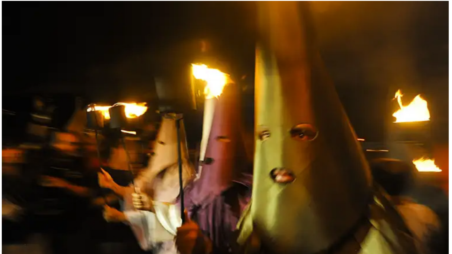
Representação sobreviveu aos séculos graças a cuidados e preocupação dos vilaboenses com a própria história

“A estética do presente, na prática de capitalização do tempo, é estabelecida a partir dos horários para a realização do evento, de modo que seja adequada aos potenciais turistas. E o futuro é a articulação com as escolas e a participação dos estudantes no evento,